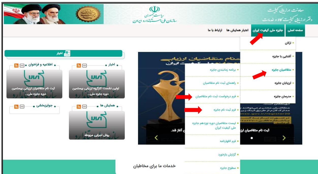
تصویر ۱: جانمایی فرم ثبت نام متقاضیان در وبسایت جایزه ملی کیفیت ایران